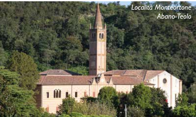
Località Monteortone Abano-Teolo

Circondato dal verde di un grande giardino privato, l'hotel è situato ai piedi del Parco Naturale dei Colli Euganei, nella tranquilla località di Monteortone a circa 1 Km dal centro pedonale della nota località termale di Abano Terme. L'Hotel dista 15 Km dal centro storico della vicina città di Padova, mentre in meno di un'ora d'auto, grazie ai collegamenti Autostradali A4 e A13, si possono raggiungere le città di Venezia, Verona, Treviso, Vicenza e Bologna.