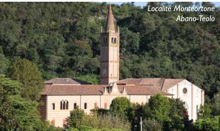
Localité Monteortone Abano-Teolo

Entouré de la verdure d'un grand jardin privé, l'hôtel est situé aux pieds du Parc Naturel des Monts Euganéens, dans la localité tranquille de Monteortone à 1 Km environ du centre piéton de la célèbre localité thermale d'Abano Terme. L'Hôtel est à 15 Km du centre historique de la ville voisine de Padoue, tandis qu'en moins d'une heure de voiture, grâce aux liaisons autoroutières A4 et A13 on peut rejoindre les villes de Venise, Vérone, Trévise, Vicence et Bologne.